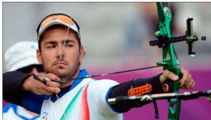
Mauro Nespoli, oro nella gara a squadre alle Olimpiadi di Londra 2012.

Serve per prendere la mira del bersaglio e a stabilire con che mano devi impugnare l'arco. Con i due occhi aperti fissa un oggetto a distanza (un calendario alla parete, la finestra di un palazzo) e puntalo con l'indice alzato della tua mano destra, allungando il braccio. Se il dito è sull'oggetto quando chiudi l'occhio sinistro, il tuo occhio dominante è il destro: verificherai anche che chiudendo l'occhio destro e aprendo il sinistro il dito sarà distante dall'oggetto. Se il tuo occhio dominante è il destro impugna l'arco con la sinistra. Altrimenti fai il contrario.