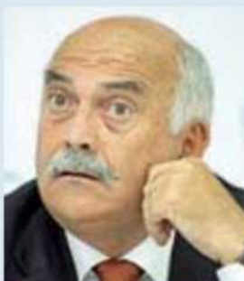
Atletica Franco Arese, 68 anni, campione europeo dei 1.500 nel '71, guida la Fidal dal novembre 2004