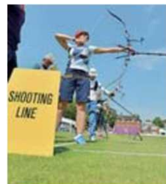
Arcieri al Lord's Cricket Ground