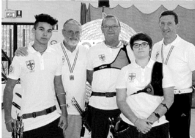
Gli Arcieri Gonzaga protagonisti ai recenti Campionati italiani a Venezia

La giovane tiratrice mantovana, tesserata per gli Arcieri Gonzaga, è alla prima partecipazione a una rassegna iridata e dunque non parte con eccessive ansie legate ai risultati: «Non punto di certo troppo in alto e ho come obiettivo una prestazione positiva nei tiri di qualifica, nei quali mi accontenterei di replicare i miei soliti punteggi. Nutro qualche speranza in più per la prova a squadre, lì possiamo fare bene». Il livello delle avversarie sarà molto elevato: «Credo che grande favorita sia la Cina padrona di casa, con Giappone e