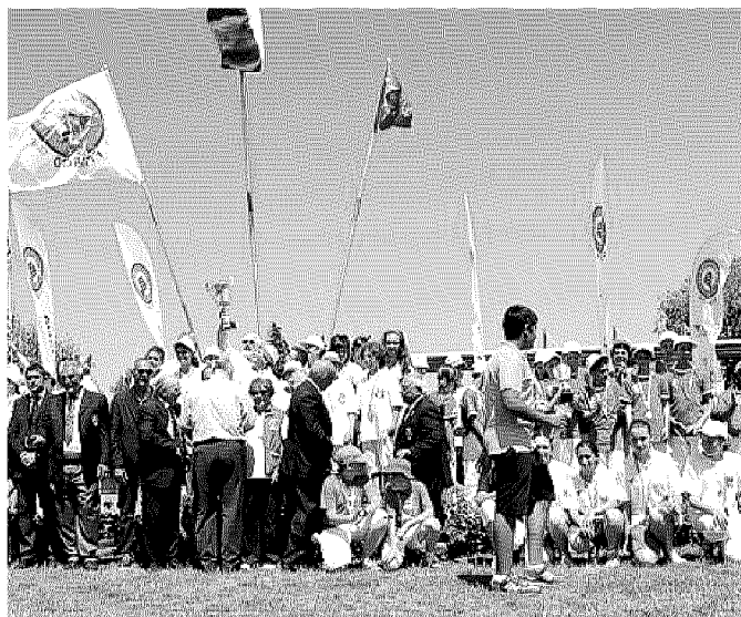
La finale del Trofeo Pinocchio nel campo sportivo Di Febo di Silvi