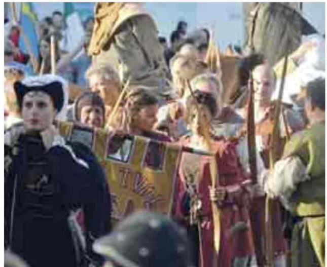
Il corteo che ha sfilato per Terni