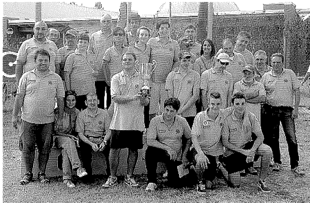
MONTALE Ki Oshi, società campione provinciale