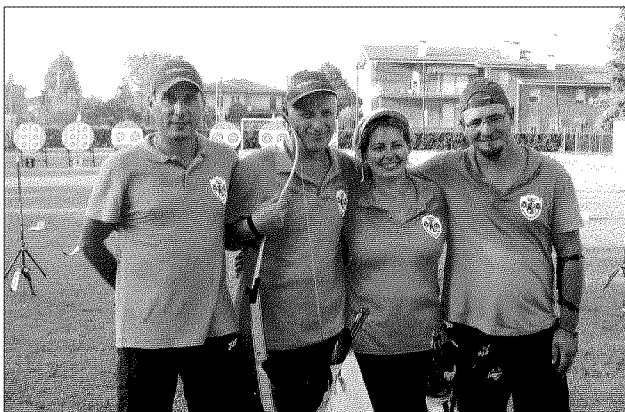
Tutti insieme Una bella soddisfazione per gli arcieri di Villadose

La stagione estiva va ormai finendo e la nuova indoor si preannuncia ruggente con i nuovi atleti.