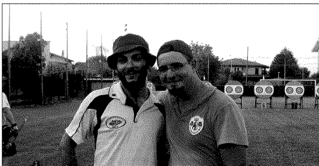
Nessuna rivalità Divertimento e amicizia i valori delle "Tigri"