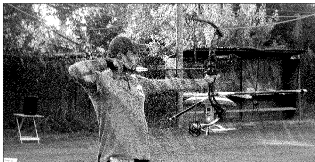
Teso Un momento della gara