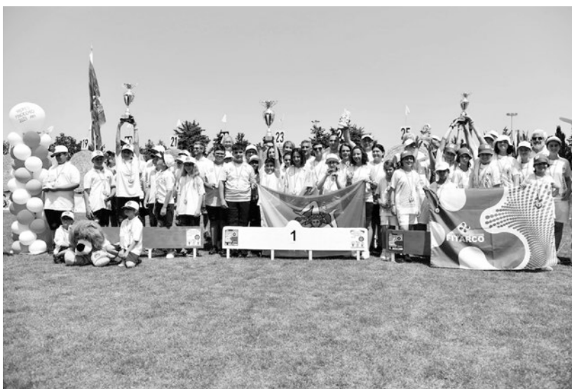
Il podio del Trofeo Pinocchio 2023 ad Atri