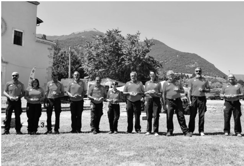
I giudici di gara ai Campionati Italiani Campagna di Castel di Sangro