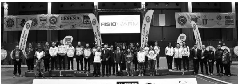
Il podio assoluto a squadre arco nudo ai Tricolori Indoor di Rimini

*Nel 2021, a causa della pandemia da Covid-19, i titoli assoluti a squadre sono stati assegnati sommando i migliori punteggi della qualifica, senza la disputa degli scontri diretti.