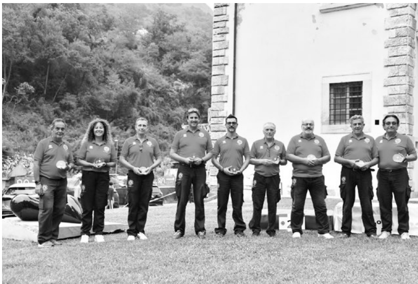
I giudici di gara ai Tricolori Targa di Seravezza