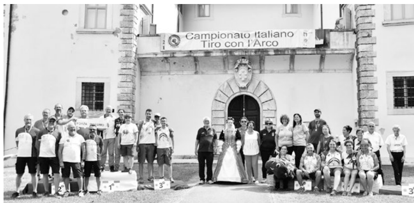
I premiati dell'arco nudo a squadre ai Tricolori Targa di Seravezza

*Nel 2021, a causa della pandemia da Covid-19, i titoli assoluti a squadre sono stati assegnati sommando i migliori punteggi della qualifica, senza la disputa degli scontri diretti.