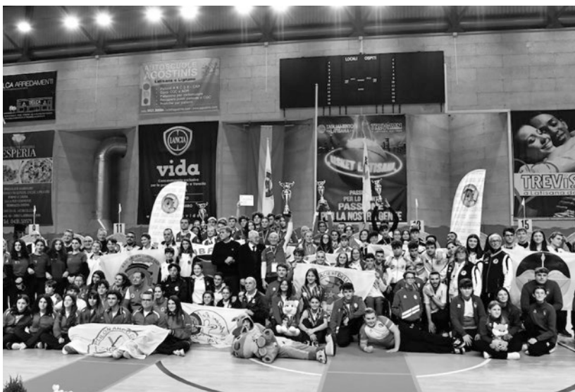
I premiati alla Coppa Italia Centri Giovanili di Latisana