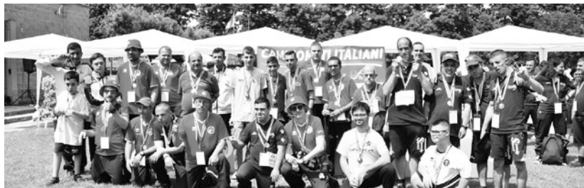
Gli atleti Fisdar premiati ai Tricolori Para-Archery di Firenze

**Dal 2022 la gara a squadre paralimpica è divenuta "doppio" con due atleti invece che tre per ogni formazione.