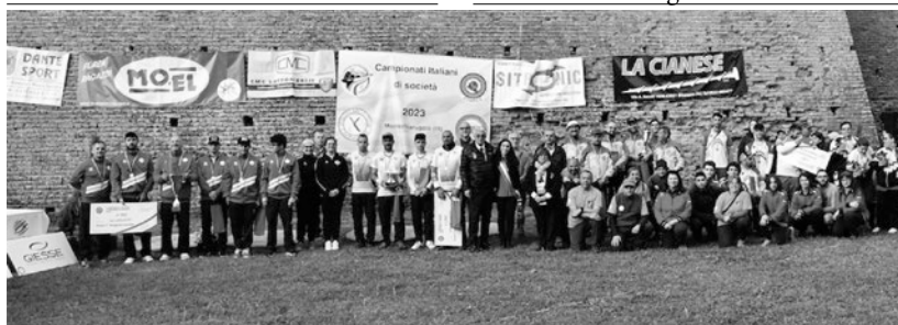
I premiati ai Campionati di Società di Montechiarugolo