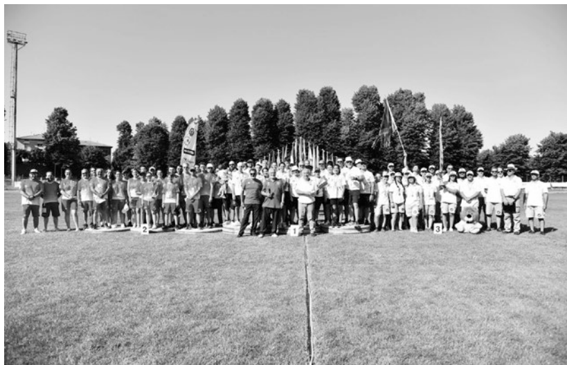
Il podio della Coppa Italia delle Regioni ad Abbadia San Salvatore

* L'albo d'oro della Coppa Italia delle Regioni comincia dal 2002, anno dell'istituzione del Memorial Gino Mattielli.