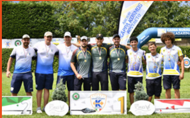
A sinistra, il podio compound femminile a squadre; a destra, il podio compound maschile a squadre