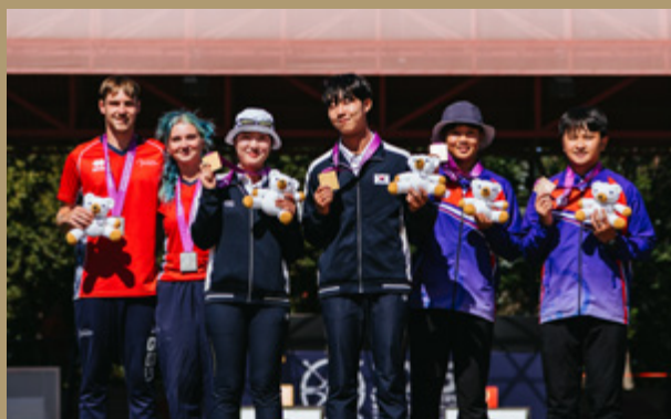
A sinistra, il podio ricurvo mixed team under 18; a destra, il podio ricurvo mixed team under 21