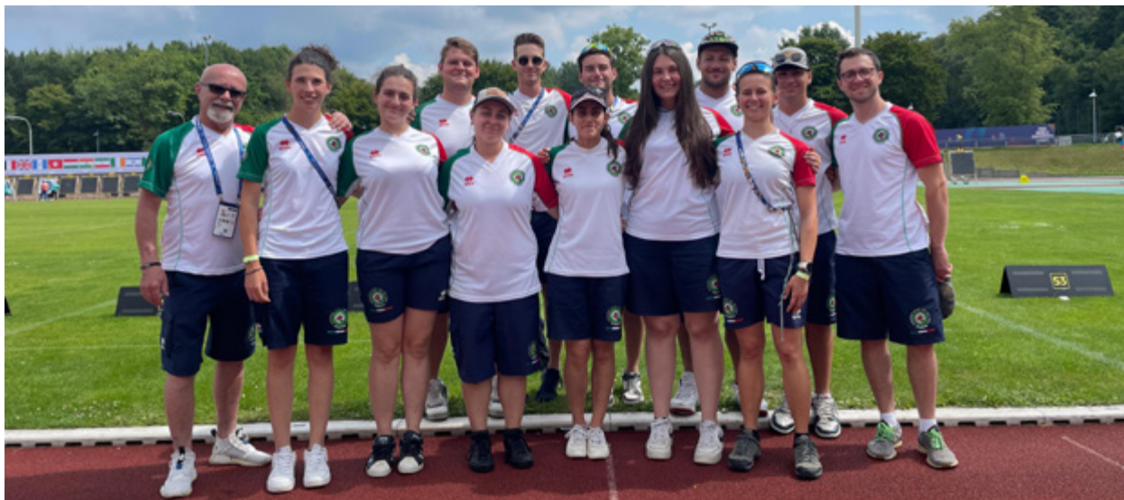
Gli arcieri azzurri ai Giochi Mondiali Universitari