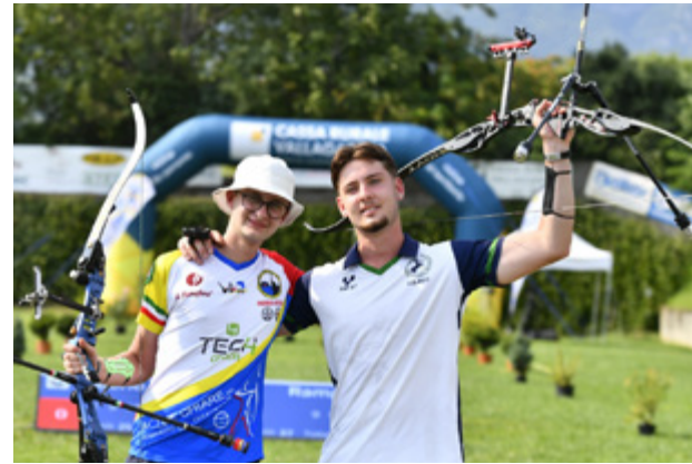
Sopra, i giovani finalisti del recurvo Rampon e Poerio Piterà; a sinistra, la sfida tutta piemontese tra Arcieri delle Alpi e Iuvenilia

Nel femminile terzo titolo negli ultimi quattro anni e quarto in assoluto per gli Arcie-