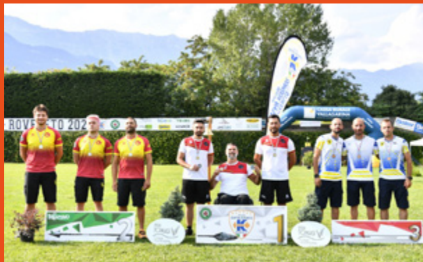
A sinistra, il podio ricurvo femminile a squadre; a destra, il podio ricurvo maschile a squadre