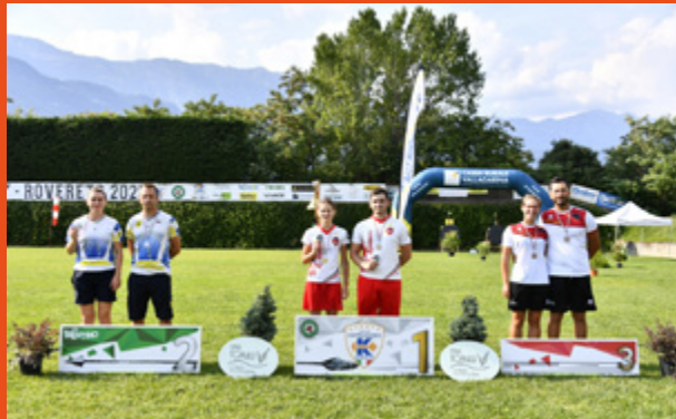
A sinistra, il podio mixed team compound; a destra, il podio mixed team ricurvo