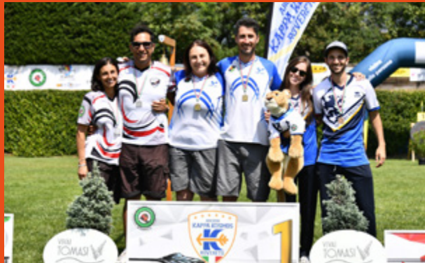
A sinistra, il podio arco nudo femminile a squadre; a destra, il podio arco nudo mixed team