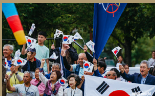
A sinistra, il podio maschile compound under 21; a destra, i tifosi coreani esultano per un Mondiale da 17 podi