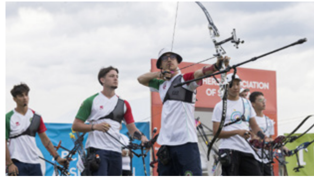
In alto a destra, il tifo degli azzurrini per i compagni di squadra; a sinistra, gli Junior del ricurvo