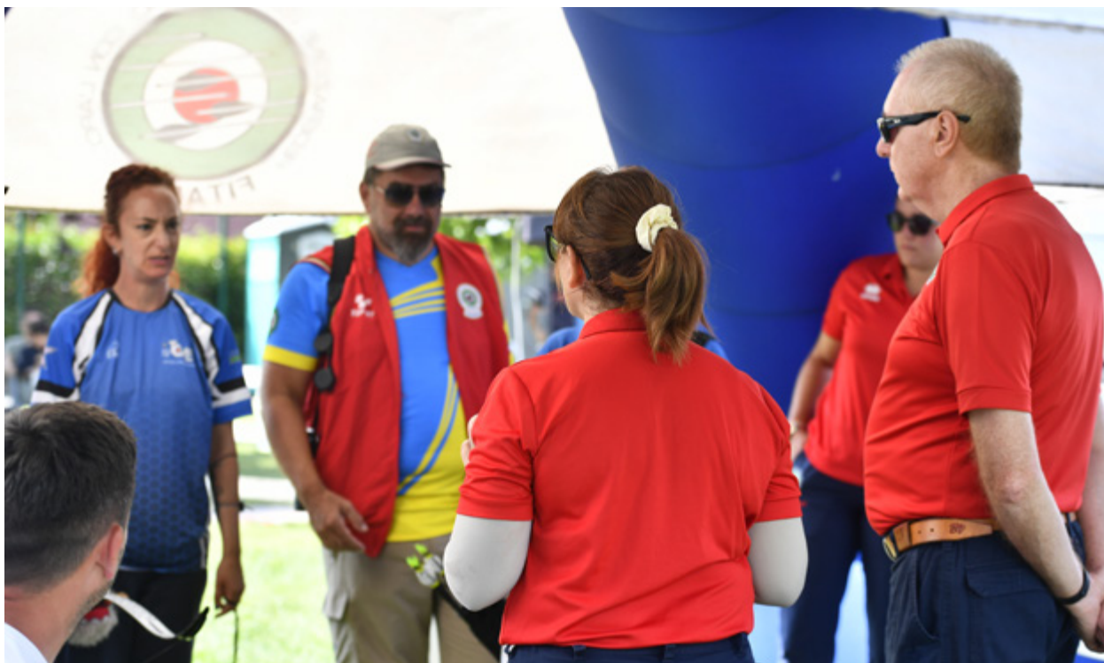
Il coordinatore arbitrale dà indicazioni a tecnici e atleti

Le procedure del blind sono per buona parte non visibili al pubblico, poiché appun-